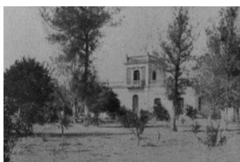
Imagen 3. Fotografía de la estancia de F. C. Sigel desde la quinta de Antonio Valli. Reproducida en: Güidotti Villafañe, 1916 (pág. 809).

Por lo expuesto, el mayor esfuerzo en la presente investigación consiste en la recuperación de fotografías históricas en repositorios locales y archivos familiares de los habitantes del pueblo. A su vez, el relevamiento fotográfico en búsqueda de las huellas de la época de la colonización en el paisaje urbano y rural de la actual Malabrigo (antiguas casas y comercios, cascos de estancia, molinos y aljibes, y hasta árboles añejos), constituye una de las tareas más importantes para la identificación de las capas históricas estudiadas.