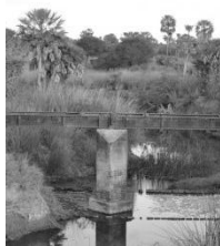
Imagen 1. Fotografía: las huellas de la naturaleza y del ferrocarril. Registro propio.

Actualmente se está abordando la segunda etapa que consta principalmente del procesamiento de la información recabada hasta el momento. Se estructuró el análisis en capas históricas como componentes progresivos de la construcción territorio y el paisaje del caso de estudio. La información obtenida se clasificó en las siguientes capas: a) El soporte natural; b) Los pueblos originarios; c) La conquista y colonización; d) El siglo XX. Luego de procesar los datos históricos referentes a cada una de ellas, se buscó reconocer sus huellas en la configuración actual del paisaje de Malabrigo.