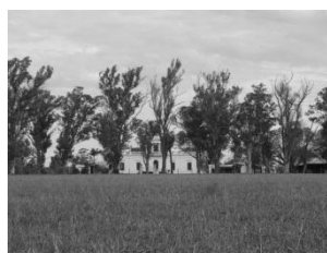
Imagen 4. Fotografía actual de la estancia de Sigel desde el mismo lugar.