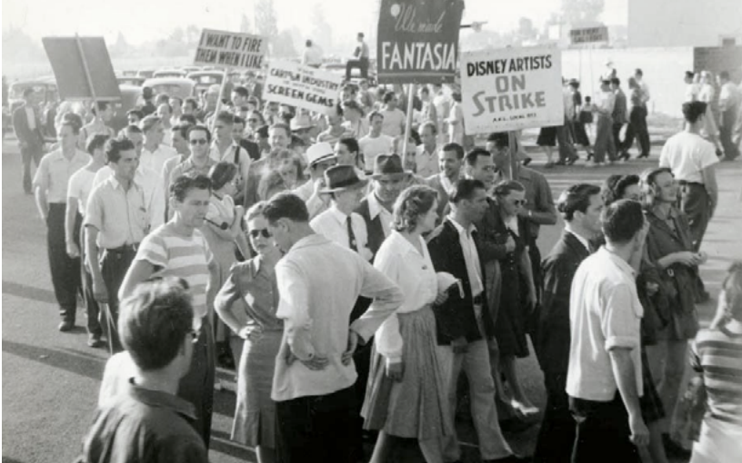
Huelga de animadores. Walt Disney se oponía a que se sindicalizaran

La huelga fue histórica. Desde el principio, unos 300 trabajadores montaron un campamento frente al estudio para garantizar el piquete de huelga. Tuvieron mucho apoyo. El sindicato de actores se sumó con entusiasmo. El sindicato de chefs montó una cocina para sostener la alimentación de los huelguistas. La central obrera de Los Ángeles manifestó su apoyo. Los trabajadores de Technicolor anunciaron el boicot a las producciones de Disney. Una columna salió desde la Warner Brothers y marchó escenificando la revolución francesa, con una guillotina, con la consigna «liberté, égalité y close-shopé (contrato colectivo)», según contó muchos años después Babbit en el documental Art Animation .