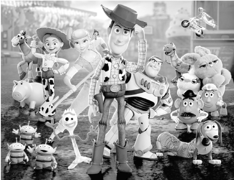
Los personajes de Toy Story 4 . Detrás de Woody se ve a Bo Peep.

A principios de los 90, Lasseter fundó los estudios Pixar, ubicados en el Emeryville, en el área de la Bahía de San Francisco, con el patrocinio de George Lucas y Steve Jobs. Introdujo la animación por computadora en un nivel nunca antes visto. Después de deslumbrar con la primera Toy Story siguieron los éxitos, con Bichos y Monsters Inc. Dueño de viñedos junto a su mujer y sus cinco hijos en el distrito de Sonoma, cobró especial notoriedad y fama cuando en 2006 Walt Disney Animation adquirió Pixar por 7400 millones de dólares. Lasseter se convirtió en director de ambos estudios y en consultor creativo para los parques de diversiones. Disney revivió, con éxitos como Ralph el demolidor , Moana y Frozen .