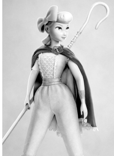
Bo Peep, la pastora de Toy Story , dejó el vestido y se arregla sola su brazo roto en la última película.

Muchos recordaron que la única directora mujer de una película de Pixar, Brenda Chapman, creadora de Valiente , había sido corrida de su puesto. «Esta es una historia que yo creé, que vino de un lugar muy personal, como mujer y como madre. Que me la hayan sacado y se la hayan dado a alguien más, encima a un hombre, fue muy angustiante en muchos niveles», contó Chapman al New York Times .