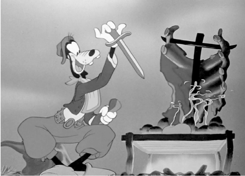
Un fotograma de Saludos amigos donde se ve al gaucho Goofy por comer un asado

Walt Disney denunció a cuatro integrantes del sindicato, entre ellos a uno de sus animadores, Dave Hiberman, ante el Comité de Actividades Antiestadounidenses.