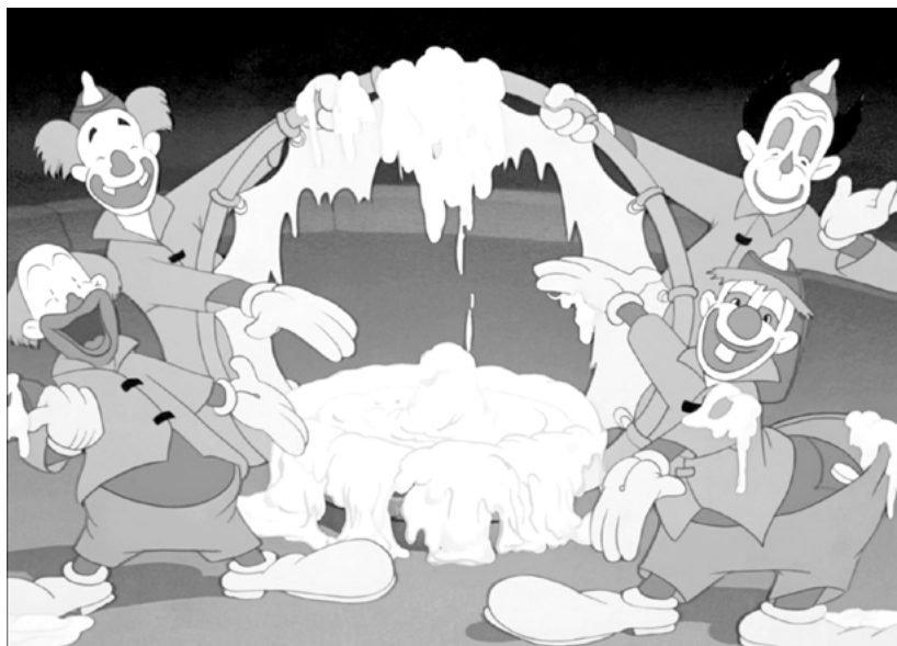
Los payasos de Dumbo hacen una huelga en una escena de la película animada de 1941, año en que se produjo la huelga de animadores de Disney

Su último trabajo de importancia en el estudio fue en marzo de 1941, en Dumbo , que se estrenó a fines de ese mismo año. Allí creó a la cigüeña de Western Union que trae al bebé elefante al circo. Y animó una escena que cobra especial relevancia al conocer lo que sucedió poco después. Ese fue su último trabajo para Disney: darle vida al momento en el que se ve la sombra de los payasos mientras cantan «golpeemos al gran jefe por un aumento», un gag que en el doblaje se pierde.