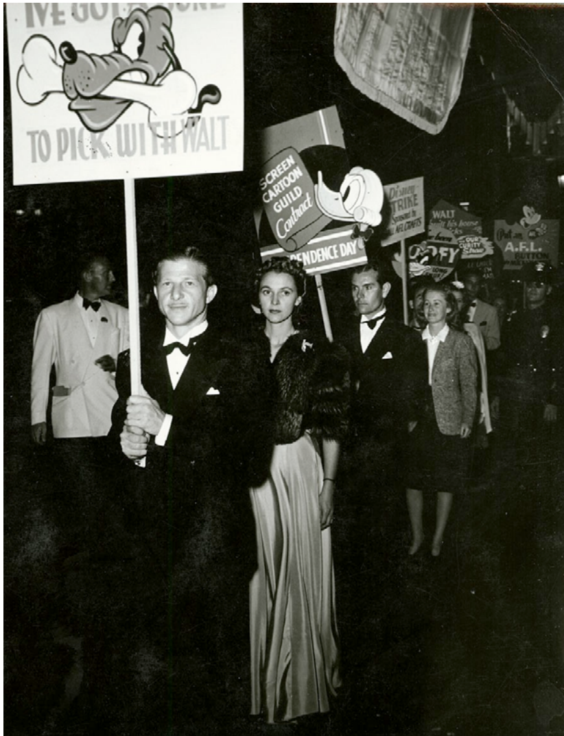
Art Babbitt vestido de gala encabeza una columna de protesta. La traducción literal de lo que dice la pancarta es «tengo un hueso para levantar con Walt». La frase significa «tengo una queja de la que quiero hablar con Walt». Es un juego de palabras con quién lo dice: el perro Pluto