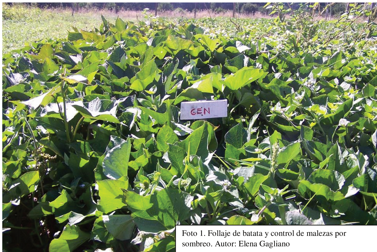
Foto 1. Follaje de batata y control de malezas por sombreo.