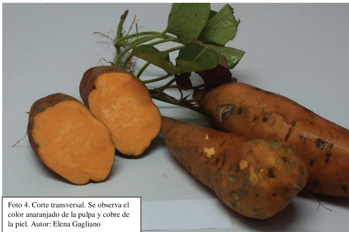
Foto 4. Corte transversal. Se observa el color anaranjado de la pulpa y cobre de la piel. Autor: Elena Gagliano