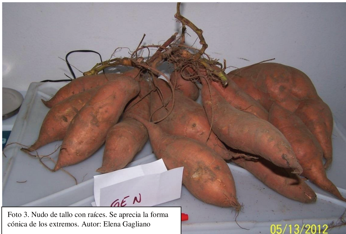
Foto 3. Nudo de tallo con raíces. Se aprecia la forma cónica de los extremos. Autor: Elena Gagliano