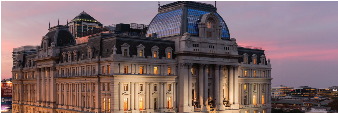
Imagen 3: Foto del exterior

“(...) y me gustaría que todo esto deje abierta una posibilidad en la comunidad sobre el significado de la arquitectura en nuestra vida cotidiana, en nuestra vida simbólica (...) este edificio tiene que poder ser visto como una producción cultural; que no son los contenidos los que están definiendo únicamente al edificio, si no la propia necesidad que exista. Eso ya es un hecho cultural. Que hayamos podido producir colectivamente uno de los edificios más grandes del mundo en términos culturales, es un mensaje que hay que extenderlo desde una perspectiva más amplia que la arquitectura (...)” —Claudio Ferrari, 2015, en “Centro Cultural Kirchner”, T1:E2, Arquitectura, minuto 10:50.