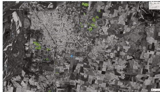
Figura 1: [Lectura propia]. (2002). En Google. Figura 2: [Lectura propia]. (2022). En Google.

Se accedió a una serie de informes desarrollados por el Consejo Federal de Inversiones durante los años 1993-1994 a pedido del Gobierno Municipal de la ciudad de Paraná, vinculados al Proyecto Parque Hortícola.