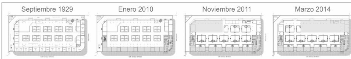
Figura 1: Historial de planimetrías. Proyecto Nuevo Mercado Norte.

poseen los mismos. De este modo, se profundizó el conocimiento del campo proyectual en que se operó.