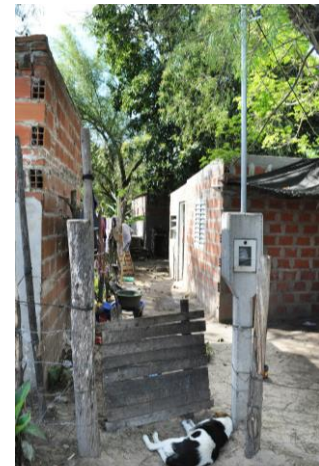
Imagen 2 y 3: Fotografías de los pasillos conformados en el Barrio Sur.