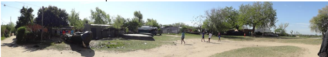
Imagen 4: Fotografía de espacios vacantes, apropiado por parte de los habitantes del barrio. Por otra parte, el análisis planimétrico y el mapeo que se encuentran en proceso, se conforman con la información obtenida de las visitas al barrio y el contacto con la comuna y los vecinos del barrio. El mismo permitirá una lectura de aspectos actuales positivos y negativos que presenta el sector, para poder realizar un posterior análisis.