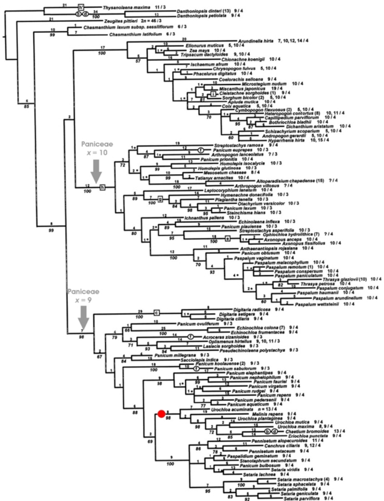
Figura 2.- Uno de los árboles más parsimoniosos obtenidos en los análisis filogenéticos propuestos por Giussani et al., (2001) para la subfamilia Panicoideae. El punto de color rojo indica la posición de Brachiaria y Urochloa en la filogenia de la Subfamilia Panicoideae y en particular dentro de la tribu Paniceae.