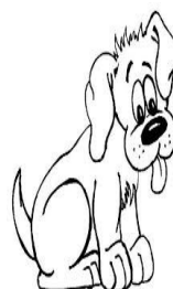
Figura 1: imagen que verá el participante en la pantalla mientras es filmado.