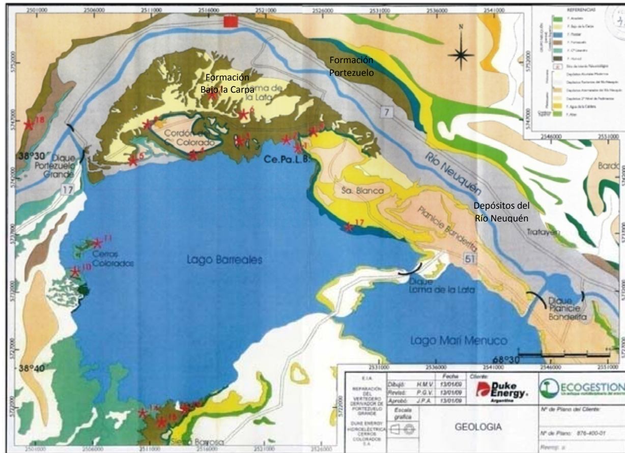
Fig. 5.4 Mapa geológico del tramo de estudio (Tomado de Duke Energy, 2009).