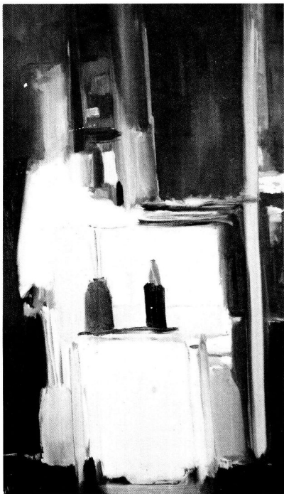
Rincón del estudio con fondo azul , 1955, óleo sobre tela, 195 x 114 cm