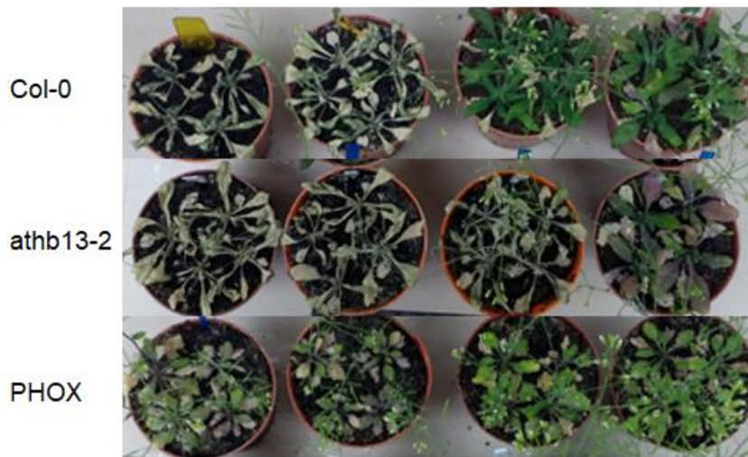
Figura 1: Fotografía ilustrativa de las plantas al quinto día de la rehidratación posterior al tratamiento de sequía. Primera fila: Col-0; Segunda fila: athb13-2 ; Tercera fila: PHOX .

Como era de esperar, la sequía afectó negativamente a la producción medida como peso total de semillas. Aunque para este parámetro no observamos una interacción significativa entre el tratamiento y el genotipo de las plantas, sí observamos una tendencia por parte de las plantas athb13-2 a disminuir más su producción bajo condiciones de sequía en comparación con las plantas Col y PHOX (Fig. 4).