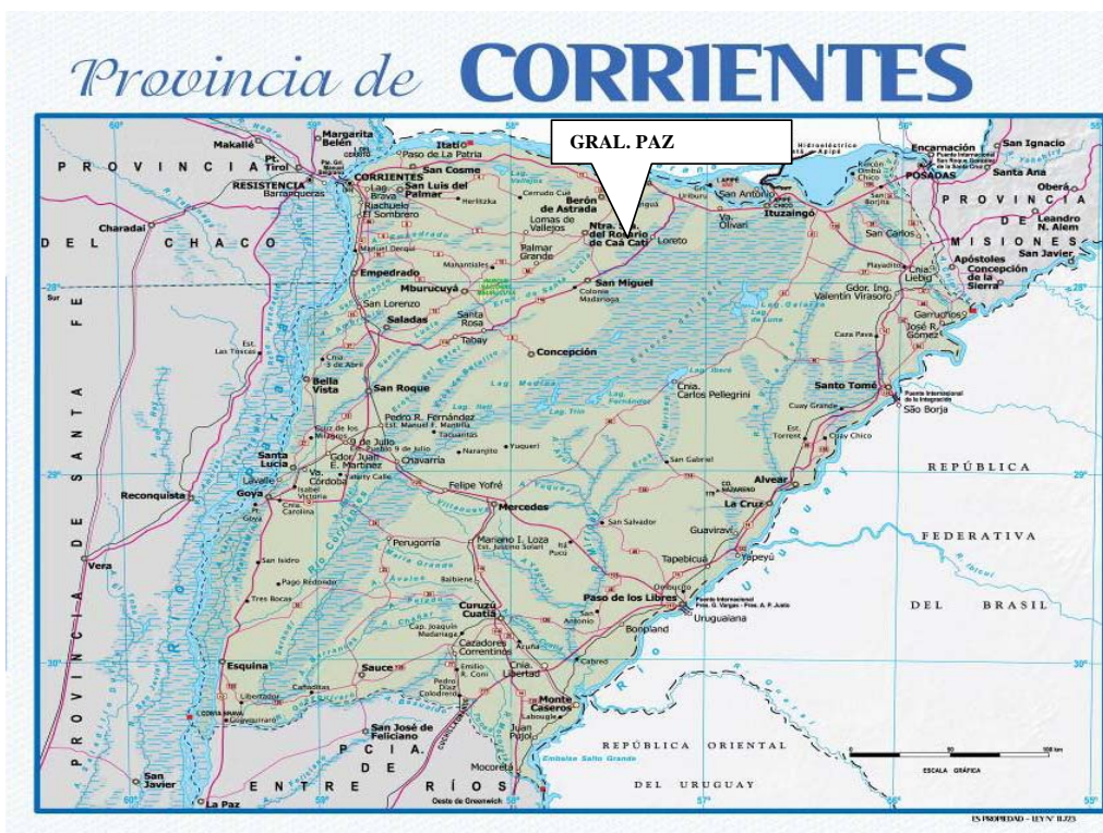
FIGURA N° 2: Provincia de Corrientes, característica de la zona de estudio.

La zona de estudio de este trabajo está ubicada en el departamento de General Paz, en el NO de la Provincia (parte occidental). El Departamento cuenta con una población de 14.761 habitantes (INDEC, 2010). Está distante a 135 kilómetros al Este de la Capital provincial. Se accede por la ruta provincial N° 5, ruta nacional N° 118 y ruta provincial N° 13. El departamento está dividido en cuatro municipios Ita Ibate, Palmar Grande, Caa Catí y Lomas de Vallejos. Los parajes Cerrito y Zapallo están situados en la jurisdicción de Lomas de Vallejos y Caa Catí.