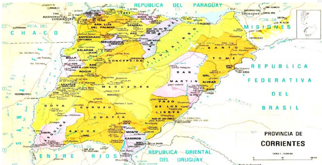
FIGURA N° 1: Zona de implementación del PROCAT en la provincia de Corrientes

En marzo de 1984 el Gobierno de la provincia de Corrientes aprueba un proyecto piloto 2 que contiene un diagnóstico y propuestas para intervenir en su zona Norte, conocida como el área algodonera y que comprende los departamentos de: Capital, San Luis del Palmar, Empedrado, Mburucuyá y General Paz.