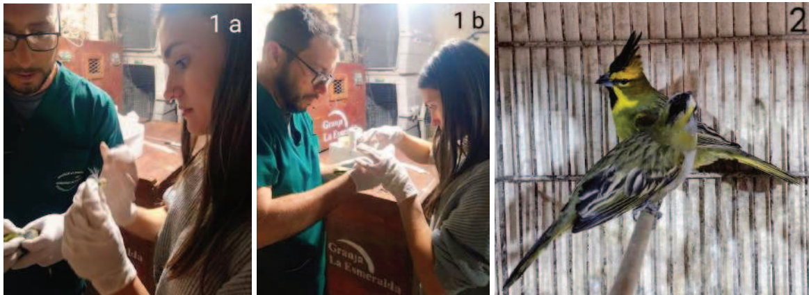
Figura 1: a) y b) proceso de toma de muestras de ejemplares de Cardenal amarillo.

Durante el periodo comprendido entre los meses de Octubre, Noviembre y Diciembre del año 2022, se procedió a la obtención de muestras de plumas y tejidos pertenecientes a 13 individuos de la especie Gubernatrix cristata , conocida como Cardenal Amarillo, los cuales habían sido objeto de tráfico ilegal y se encontraban bajo custodia en el Centro de rescate, recepción, rehabilitación y reinserción de fauna "Granja La Esmeralda" (Figura 1 y Figura 2). Asimismo, se tomó una muestra de un ejemplar taxidermizado recolectado en la fecha del 15 de Octubre de 1931 en la localidad de San Cristóbal, provincia de Santa Fe.