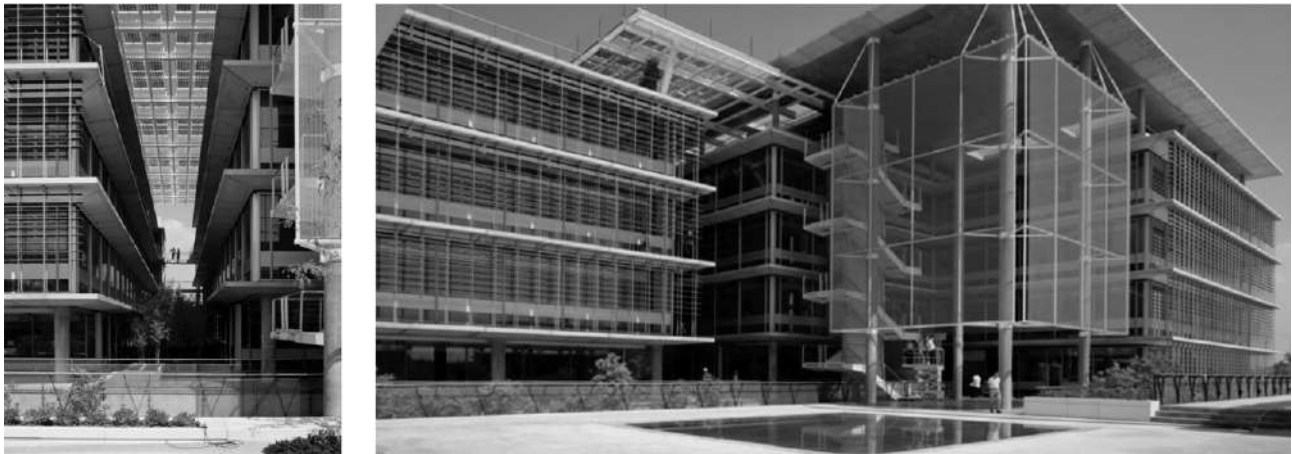
FIGURA 7 | A la izquierda, detalle de la cubierta fotovoltaica sobre un espacio semicubierto. A la derecha, se observan el tratamiento diferencial de las envolventes de acuerdo a la orientación.