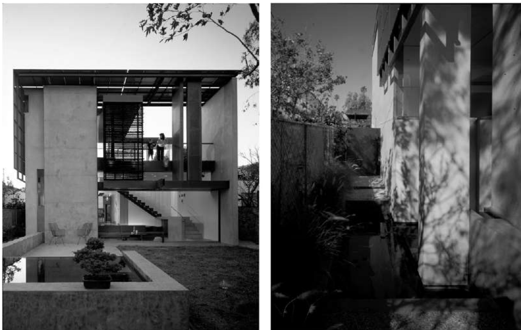
FIGURA 8 | A la izquierda, el patio de recepción con una piscina que se derrama en todo el costado de la vivienda, como puede observarse en la imagen de la derecha.