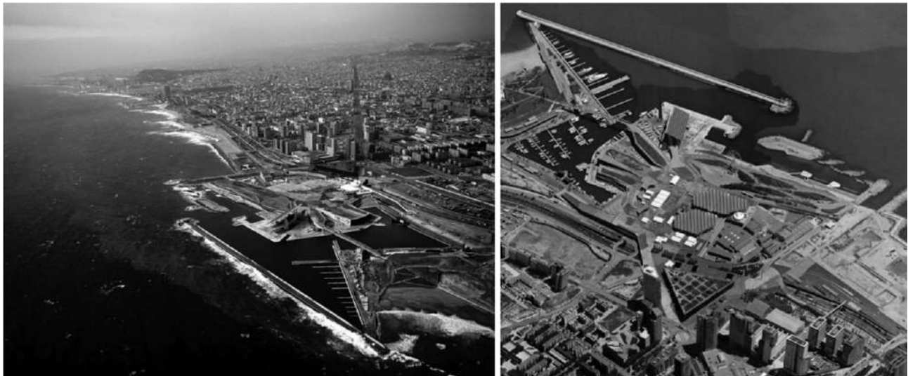
FIGURA 2 | A la izquierda, vista posterior de la Solar Plant desde el Mediterráneo. A la derecha, vista frontal desde la ciudad de Barcelona.