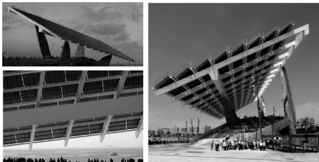
FIGURA 3 | Distintas imágenes de la pérgola que muestran la escala de la intervención y algunas aproximaciones a la materialización y la espacialidad de la propuesta.