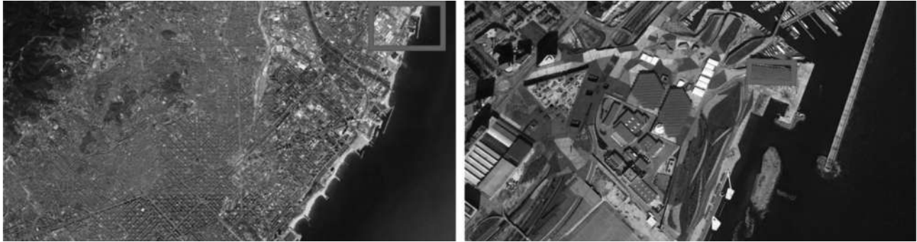
FIGURA 1 | A la izquierda, emplazamiento de la Solar Plant en la ciudad de Barcelona. A la derecha, implantación de la pérgola en el sector costero y como parte de una intervención urbana mayor.