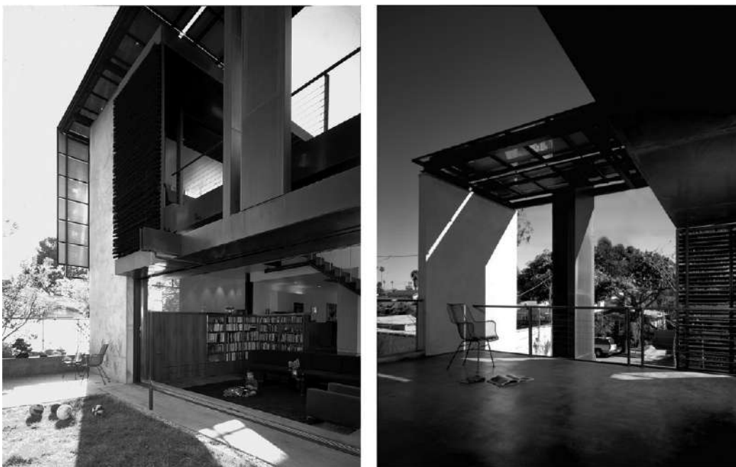
FIGURA 9 | El gran paraguas solar colabora con la concreción de una gran fluidez entre espacio interior y exterior.