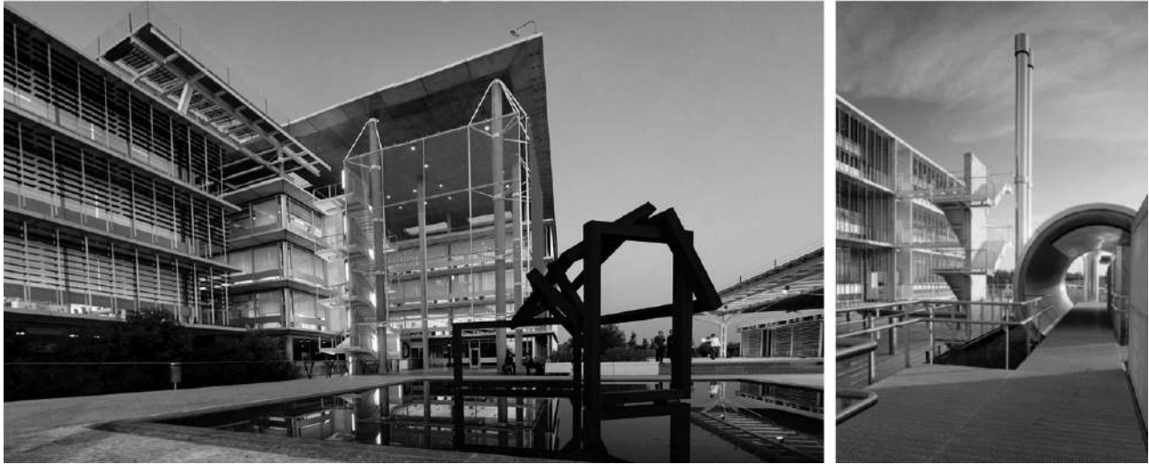
FIGURA 6 | A la izquierda, imagen del patio central que articula los distintos pabellones. A la derecha, detalle de sector de circulación.