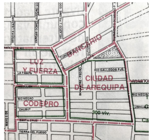
FIGURA 04 | Imagen del barrio «300 viviendas», oficialmente «Ciudad de Arequipa», rodeado de otros grupos habitacionales, a través de un plano municipal.