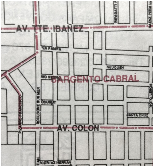
FIGURA 08 | Imagen del barrio «Plan VEA», oficialmente «Sargento Cabral», a través de un plano municipal.