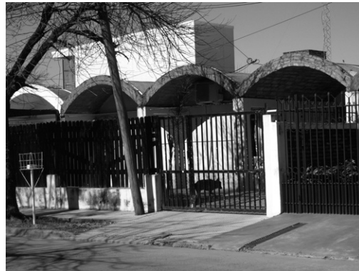
FIGURA 06 | Vivienda en estado original, caracterizada por la cubierta de bóvedas de ladrillos.