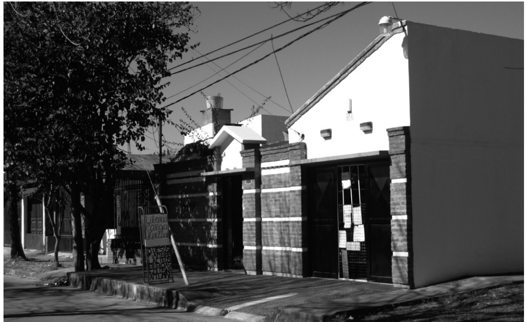
FIGURA 11 | Vivienda sustancialmente modificada respecto de la original en el barrio «300 viviendas».