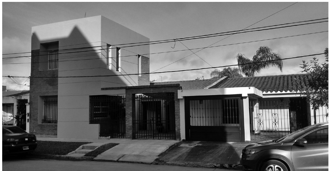
FIGURA 12 | Viviendas del barrio «Plan VEA» al presente con intervenciones edilicias.