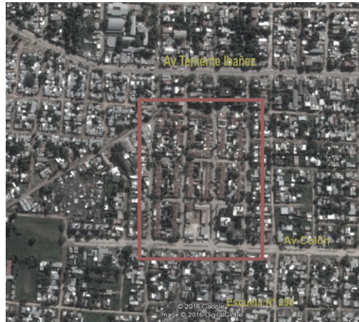
FIGURA 07 | Imagen satelital del barrio «Plan VEA».