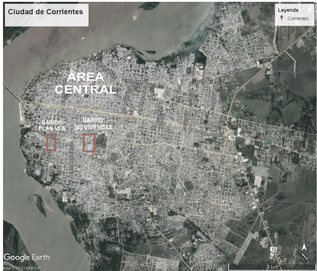
FIGURA 02 | Plano de la ciudad de Corrientes con la ubicación de los barrios en estudio.