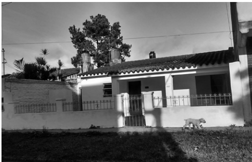
FIGURA 10 | Imagen de las viviendas en estado original, caracterizadas por la cubierta en pendiente a dos aguas en losa de hormigón armado recubierta con tejas españolas.