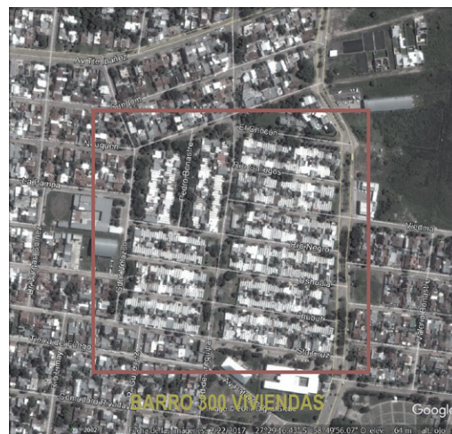
FIGURA 03 | Imagen satelital del barrio «300 viviendas».