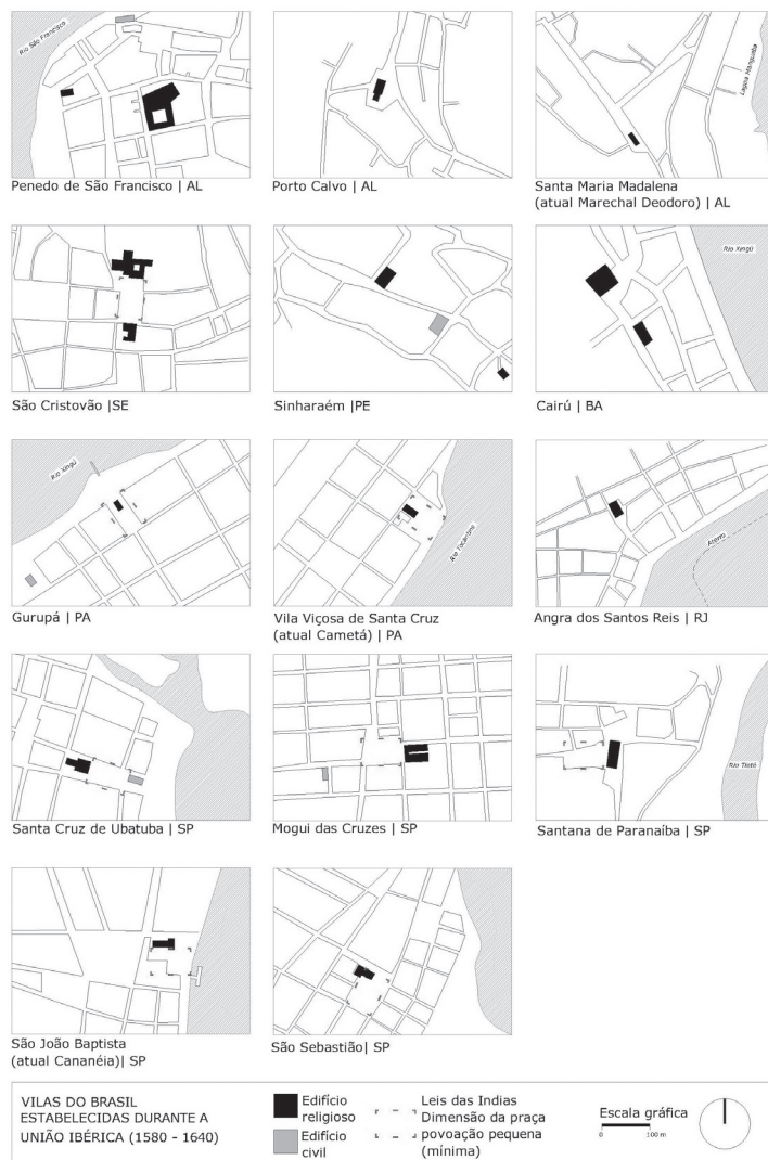
FIGURA 3 | Plantas dos núcleos iniciais das Vilas do Brasil estabelecidas durante a União Ibérica.