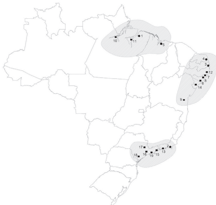
FIGURA 2 | Situação das cidades e vilas estabelecidas no Brasil durante a União Ibérica.