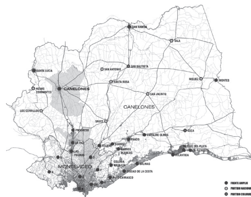
Figura 2 | Los municipios en Canelones y Montevideo.

El proceso de definición de cuántos y cuáles municipios habrían de instalarse en cada departamento dependió de las disposiciones legales y posicionamientos de los gobiernos departamentales y varió con las visiones políticas a nivel de éstos. Las posiciones se ordenaron en una gama de opciones entre aquellas que se situaron favorables a la descentralización y la instrumentación de la ley (los casos que además optaron por el criterio