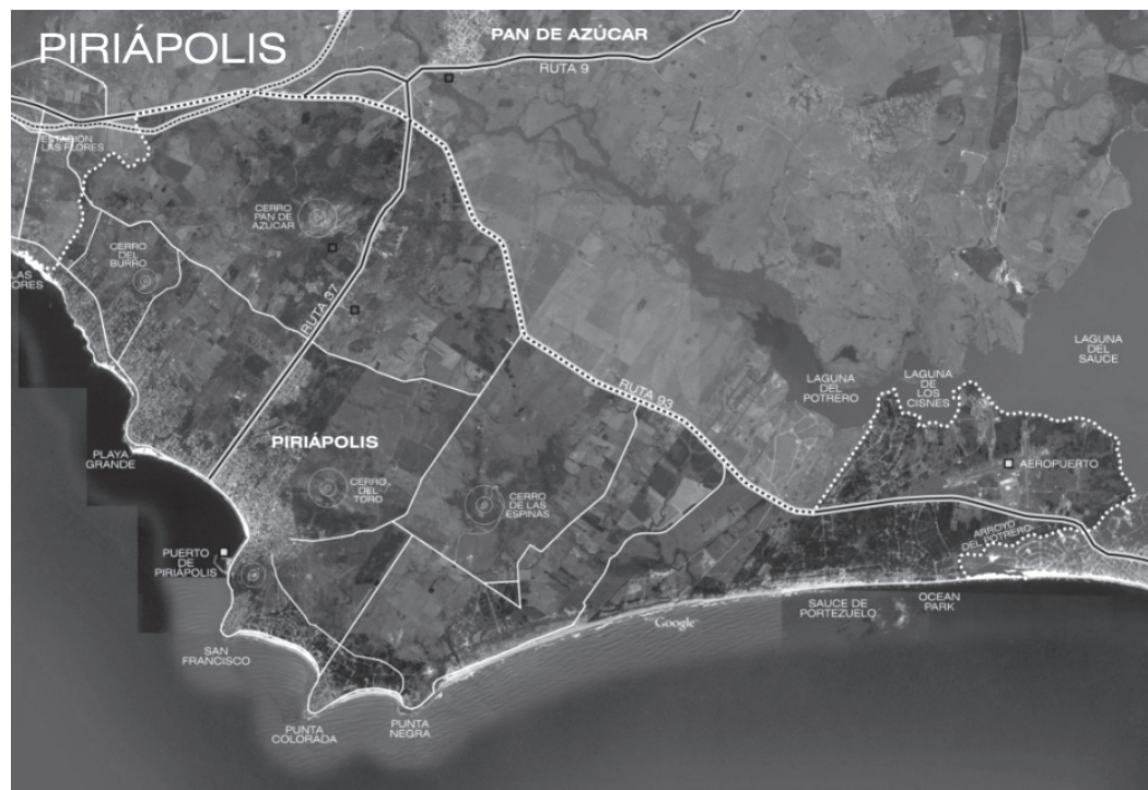
Figura 5 | Municipio de Piriápolis.

En 2005 se inició un proceso a escala departamental liderado por la Intendencia y en el contexto de un Convenio con la Universidad por medio del cual la Facultad de Arquitectura desarrolló un proceso participativo a escala de cada una de las microrregiones identificadas en el departamento y a escala departamental. Ello culminó con la publicación de nueve cuadernos territoriales, uno por cada microrregión y uno departamental. En ellos se sistematizaron y presentaron de forma ordenada la información territorial, los antecedentes y los proyectos y se registró el proceso participativo. Culminó, en cada caso, con la elaboración de una «agenda de proyectos estratégicos» que incluyó proyectos de muy diversa escala y naturaleza.