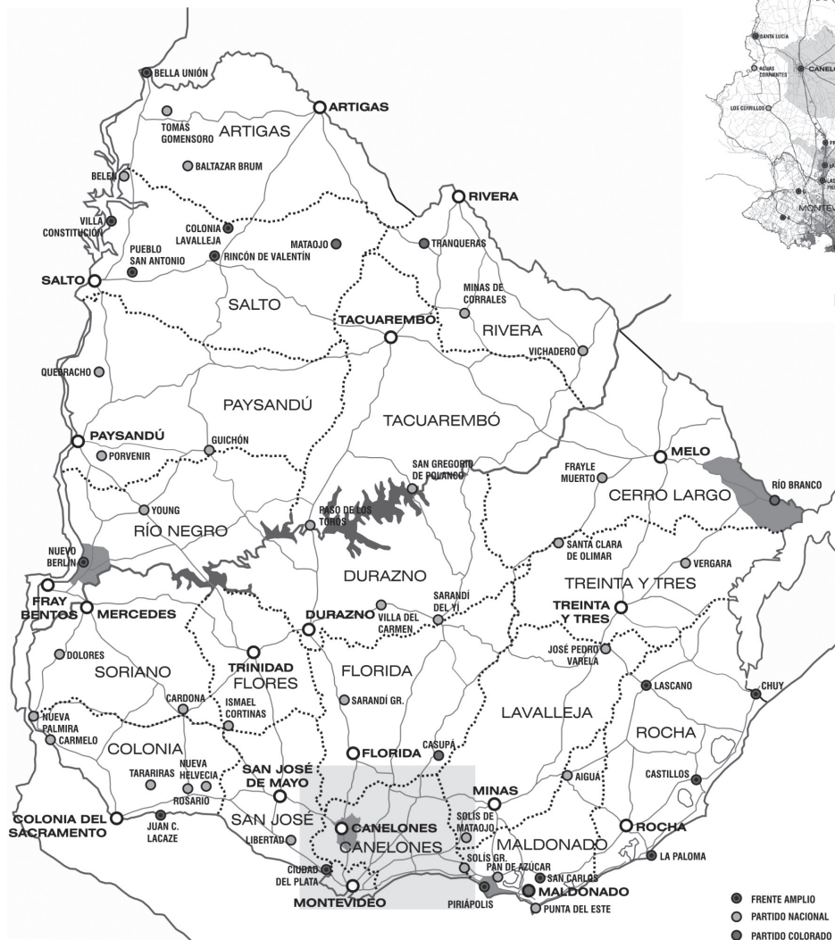
Figura 1 | Distribución de los municipios en el territorio.