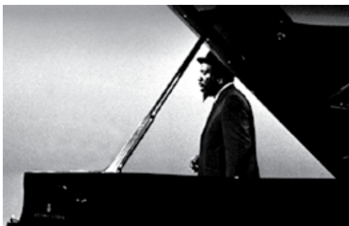
Crónica de un verano | Thelonious Monk Straight no chaser | Escuela Normal | Crazy horse