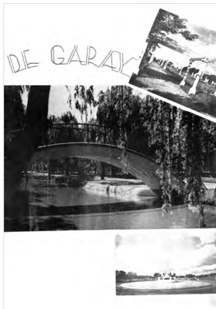
Imagen 4. Revista Ciudad de Santa Fe, Número Homenaje al Tercer Congreso Eucarístico Nacional | 1940

esta publicación. Con una perspectiva cuyo epígrafe expresa «interesante proyecto de la fuente que será construida frente al Convento de San Francisco, en el parque Cívico del Sur. Un atractivo más para el hermoso paseo santafesino» comienza el artículo: «El Parque Cívico del Sur. Un aporte edilicio de singular valor», que en la página siguiente, presenta esta planta del proyecto (imagen 5) que agrega «vista panorámica del proyecto del Gran Parque Cívico y Balneario