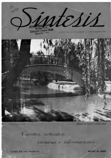
Imagen 3. Revista Síntesis | Mayo 1940 | Portada color