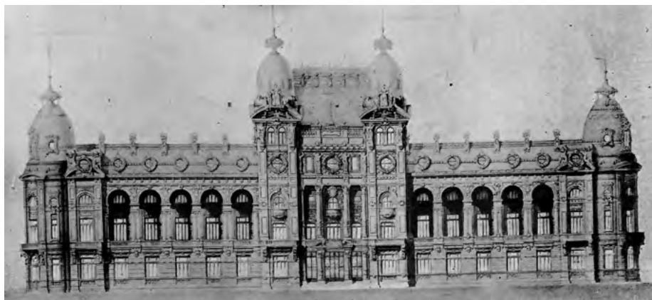
Imagen 2. Casa de Gobierno de la Provincia en construcción | Número Único | Inauguración del Puerto de Ultramar Santa Fe | 1910

escala y jerarquía del edificio, sino por el grado de sustitución que implicó la demolición de la sede administrativa de la ciudad en épocas de la Colonia, por una propuesta arquitectónica de lenguaje ecléctico —propio de la época— que combina rasgos borbónicos franceses con elementos del academicismo italiano.