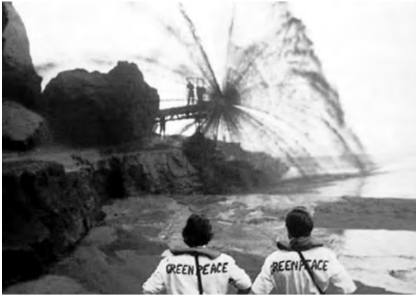
Ilustración 4. Activistas de Greenpeace observan el corte de los «chorros» en 1986. Autora: Lorette Dorreboom. Fuente: www.greenpeace.org

de futuro de la comunidad, como un complemento deseable para una industria minera que cada vez mostraba más signos de debilidad y como una herramienta para recuperar y mejorar una situación ambiental cuya degradación era absolutamente visible.