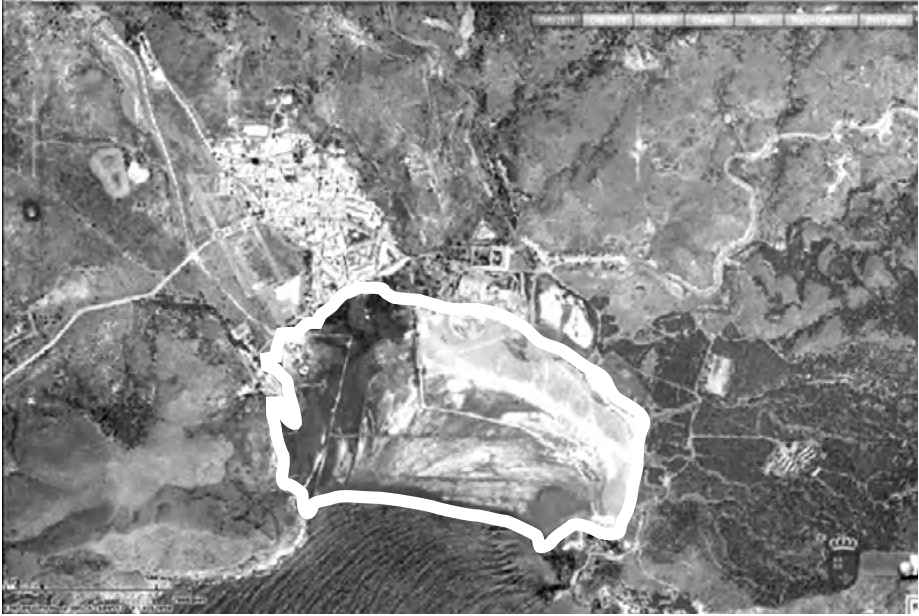
Ilustración 3. Portmán 2011. Delimitada puede distinguirse la zona anegada por residuos mineros.

trabajadores, aunque sin abandonar la idea de rehabilitar la bahía con fondos públicos para explotarla urbanística y turística.