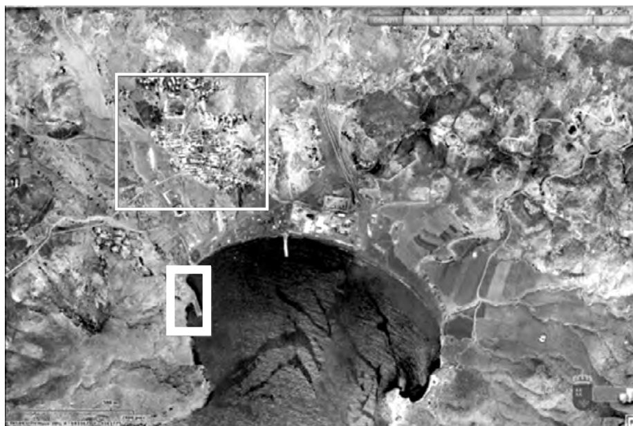
Ilustración 2. Portmán 1929. En línea fina el pueblo de Portmán, en línea gruesa el puerto pesquero.