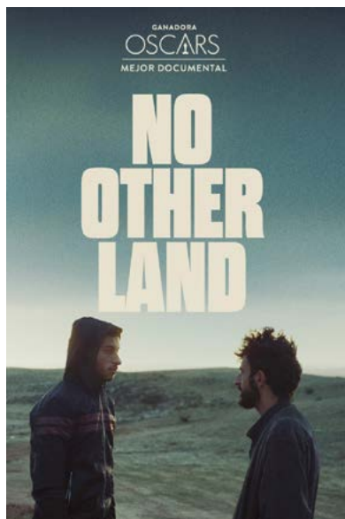
Imagen 2. Póster de No Other Land , ganadora del Oscar a mejor documental.

A toda esta barbarie se suma la dificultad de distribución y reproducción que tiene el documental en gran parte del mundo por diversos lobbies y los negacionismos en boga. En Argentina no ha llegado a las salas comerciales, pero la solidaridad de nuestro pueblo hace que se viralice por diversos medios y, de esta manera, se puede acceder a la película con subtítulos en español. El individualismo rampante del que se vanagloria nuestro gobierno actual, por fortuna, no alcanza a una parte de la población que todavía es consciente de que la patria no solo es el otro conciudadano, sino el otro oprimido y violentado en diversas partes del mundo.