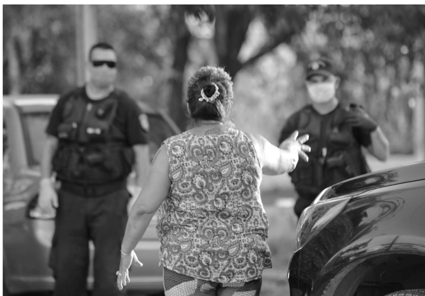
Manifestación de familiares de detenidos por las condiciones de detención y represión durante las protestas ocurridas en la Unidad Penitenciaria n° 2 de Santa Fe en el marco de la declaración del aislamiento social por el Covid-19, marzo 2020.

De este modo, queda configurado un tangram de rasgos culturales comunitarios construido en relación al esquema ineludible en la literatura de la cultura policial tradicional. Estos contornos analíticos nos han servido para ordenar algunas representaciones de los/as policías comunitarios/as y nos impulsan a realizarnos aún más preguntas respecto de su contenido, su ordenamiento, y nos dejan algunas pistas de la complejidad de las modificaciones de ciertos rasgos culturales policiales en nuestros contextos.