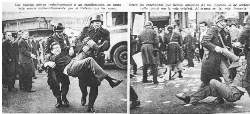
Figura 2. Manifestación