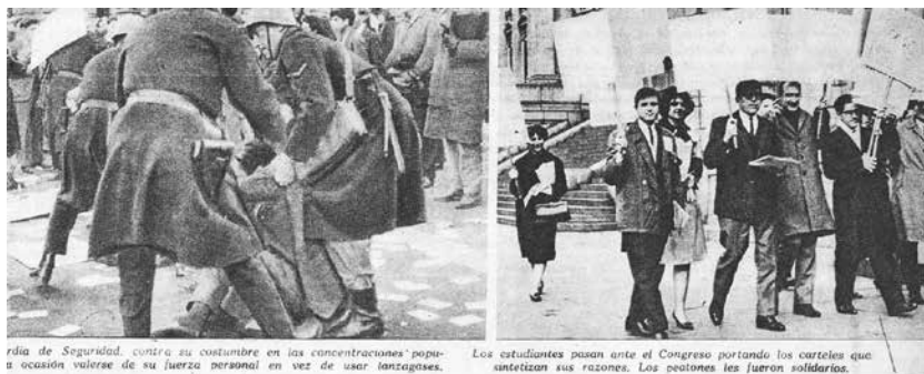
Figura 3. Manifestación