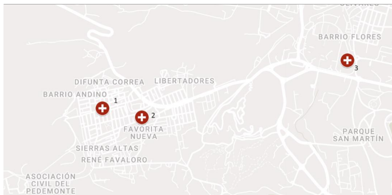
Figura 2: Ubicación geográfica de los Centros de Atención Primaria utilizados por la población de “La Favorita”

Descripción: Centros de Atención Primaria de la Salud (CAPS) utilizados por la población de “La Favorita”: 1) CAPS N° 367 Barrio Andino. 2) CAPS N° 300 Dr. Arturo Oñativía. 3) Centro Universitario de Salud Familiar y Comunitaria FCM UNCuyo.