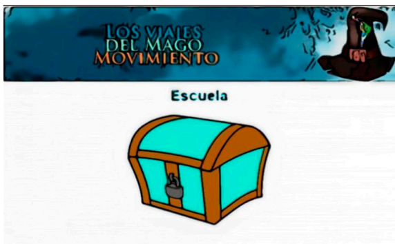
Figura 2. Cofre “Escuela” creado y diseñado en plataforma Moodle para la presente experiencia.

Mago Movimiento. A modo de ejemplo, en la Figura 2 agregamos la imagen de la estación “Escuela” —cofre celeste—: