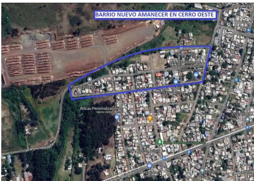
Figura 2. Ubicación del barrio Nuevo Amanecer en la subzona Cerro Oeste (Zonal 17 – Municipio A)