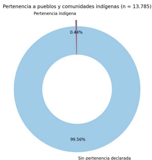
Figura 3. Pertenencia a pueblos a pueblos y/o comunidades indígenas en la Facultad de Ciencias Políticas y Sociales de la Universidad Nacional de Cuyo

Nota. Los gráficos fueron generados utilizando Python y su ecosistema de bibliotecas de código abierto.