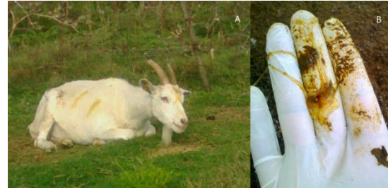
Figura 2: Cabra afectada con “fascie” deprimida y signos de cólico (a). Materia fecal pastosa con abundante presencia de moco (b).

En el experimento los animales correspondientes al grupo tratado presentaron signos clínicos en el lapso de 7 y 21 horas post-administración (Figura 2). Los hallazgos clínicos se exponen en la Tabla 1. Ninguno de los animales murió y todos se recuperaron a las 72 hs. post-administración. En las cabras del grupo GT se registró un incremento en la frecuencia cardíaca (Figura 3) que señalan leve o moderada taquicardia.