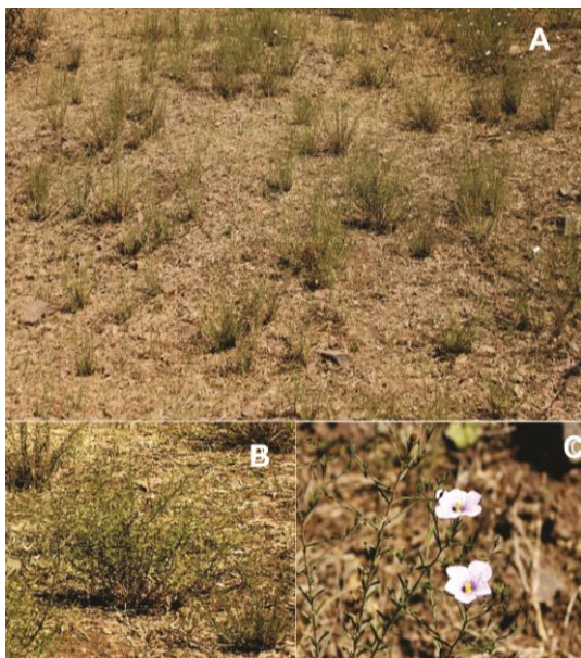
Figura 1: Nierembergia linariifolia var. linariifolia , presente en un área de pastoreo (a). Detalle de planta (b) y flor (c).

El objetivo del presente trabajo, fue comprobar experimentalmente la intoxicación ocasionada por N. linariifolia var. linariifolia en cabras. Para esto, se emplearon seis cabras hembras, adultas (de 40 a 55 kg de peso), de raza Sannen. Las mismas fueron divididas en dos grupos de tres animales cada uno. El “grupo tratado” (GT) recibió una única dosis de 10 g de MS de hojas y tallos finos de planta ( N. linariifolia var. linariifolia ) molida/kg de peso vivo mediante el empleo de sonda esofágica. El “grupo control” (GC) en su lugar recibió heno de alfalfa molido. Todos los animales fueron mantenidos en único corral donde se les ofreció heno de alfalfa de buena calidad constantemente y agua fresca ad libitum . La inspección clínica e ambos grupos fue efectuada a las 0, 3, 7, 21, 28, 45, 51 y 72 horas post-administración. En cada observación se efectuó una inspección semiológica completa. Las plantas (Figura 1) para la obtención del material molido fueron colectadas en el paraje “El Cebilar”, ubicado próximo a la localidad de Guachipas departamento la Viña provincia de Salta (S25° 61', W 65° 46'). Durante la colecta se extrajeron muestras herborizadas para identificación botánica. Las mismas fueron depositadas en el herbario MCNS de la Universidad Nacional de Salta, registradas como MCNS13353.