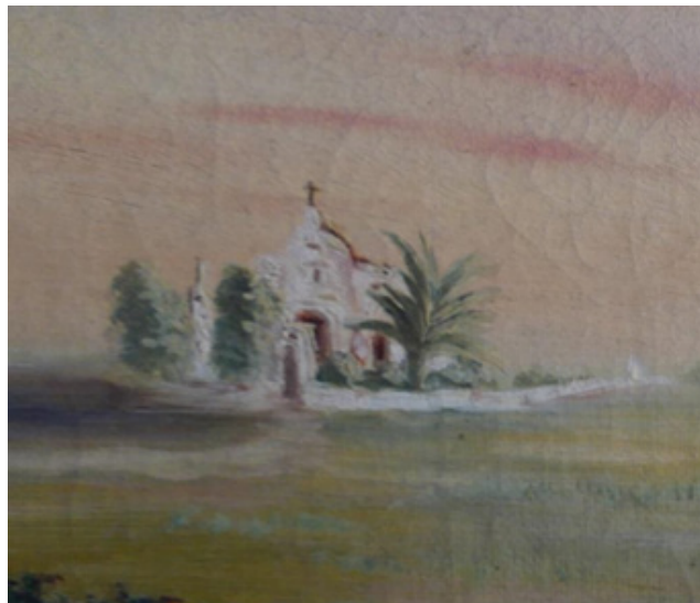
Imagen de la vieja capilla de Guadalupe, erigida por el ermitaño Francisco Javier de la Rosa en 1780. La actual Basílica comenzó a construirse en 1904 bajo las órdenes del arquitecto Juan Bautista Araldi y fue inaugurada el 8 de mayo de 1910. Quedó como testigo de la antigua capillita la palmera, plantada el 5 de febrero de 1820 en ocasión de la boda de Doña María del Barco y que fuera troncada por una tormenta en las últimas décadas del S. XX.