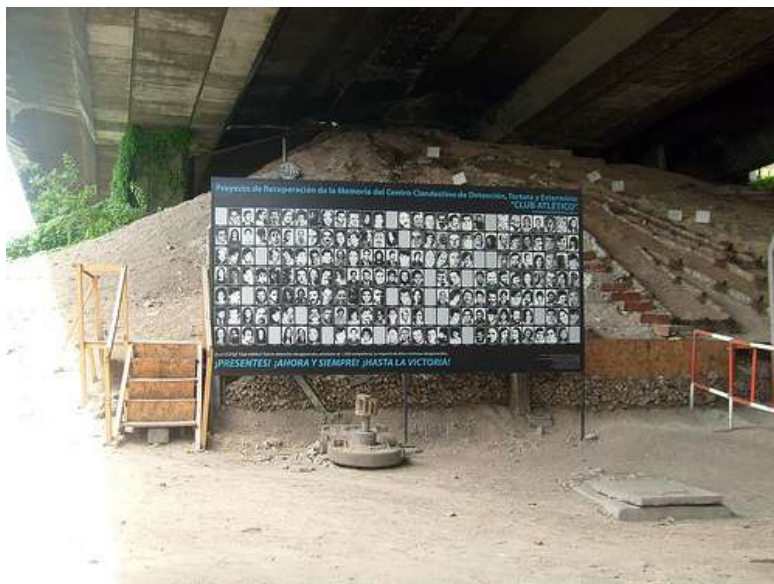
IMAGEN 6. CCDTyE “El Atlético” en la actualidad Espacio para la Memoria y Promoción de los Derechos Humanos