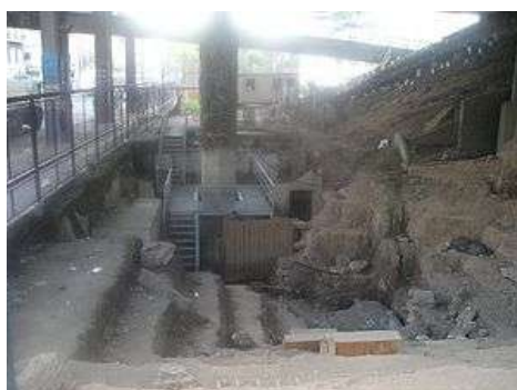
IMAGEN 7. CCDTyE “El Atlético” en la actualidad

Según el relato de sobrevivientes de los campos de concentración en entrevistas que hemos realizado con el equipo de investigación bajo la dirección de Raúl Minsburg, 8 otras publicadas en diferentes medios y archivos correspondientes a las declaraciones en los juicios contra los represores, podemos destacar el uso del tabique y el aislamiento como condición generalizada. Por lo tanto como hemos señalado, el sentido de la audición se convirtió en la principal manera en la que podía establecerse una conexión con el entorno.