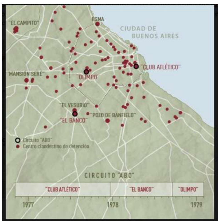
IMAGEN 5. Circuito “ABO” Espacio para la Memoria y Promoción de los Derechos Humanos

La fuerza a cargo de este espacio era la Policía Federal, aunque había detenidos que dependían de otras fuerzas como la ESMA, Campo de Mayo y Vesubio. Cuando el “Club Atlético” fue demolido, lxs detenidxs fueron llevadxs provisoriamente al ex CCDTyE “El Banco” (Camino de Cintura y Autopista Ricchieri, Provincia de Buenos Aires), hasta que se terminó de acondicionar el ex CCDTyE “Olimpo”. Estos tres centros conformaron en adelante el “circuito ABO” (“Atlético”- “Banco”- “Olimpo”).