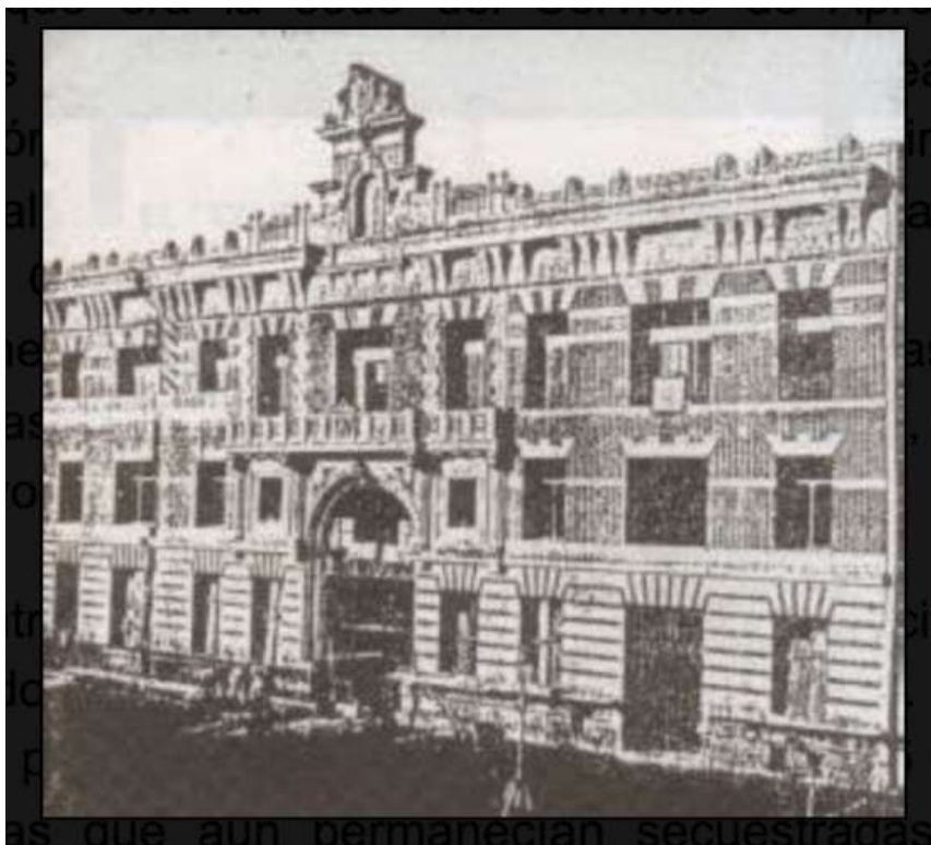
IMAGEN 1. Frente del edificio donde funcionó el CCDTyE “El Atlético” Espacio para la Memoria y Promoción de los Derechos Humanos

La dictadura cívico-militar de 1976 llevó adelante un plan sistemático que operó territorialmente por zonas y sub-zonas, utilizando como recursos logísticos los denominados “grupos de tareas”, los centros clandestinos de detención y el recurso del secuestro y desaparición forzada de personas. Los centros clandestinos de detención tuvieron distintas funciones: además de la aplicación de tormentos, fueron lugares de exterminio, maternidades clandestinas, lugar de acopio de bienes materiales de secuestrados y centros operativos de Inteligencia, entre otras. 5