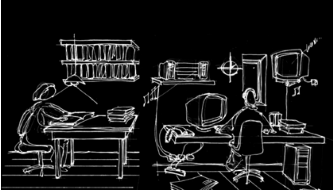
Primeros abordajes teóricos, tecnológicos y proyectuales.

El ciclo básico de la Carrera de Arquitectura y Diseño, es de carácter introdutorio y está compuesto por primero y segundo año; tiene como propósitos fundamentales, introducir al estudiante en los aprendizajes iniciales y además, intenta favorecer la integración de los distintos saberes provenientes de cada una de las tres áreas específicas que componen el Plan de Estudios: Áreas de Ciencias Sociales, Tecnología y Diseño.