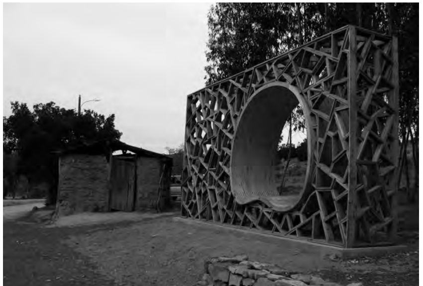
FIGURA 2: Gallinero en Pelarco. Fotografía: Manuel Gaete. FIGURA 3: Bodega de herramientas en Pejerrey. Fotografía: Felipe Alarcón. FIGURA 4: Proceso de construcción de Horno de ladrillo artesanal. Curicó, 2011. Fotografía: Diego Parra. FIGURA 5: Obra de título: Horno de ladrillo artesanal invertido de Diego Parra. Curicó, 2011. Fotografía: Diego Parra. FIGURA 6: Obra de título: Pabellón de Acopio en Pinohuacho de Rodrigo Sheward. Villarrica, 2005. Fotografía: Germán Valenzuela. FIGURA 7: Obra de título: Landmark Ruta Secano Interior Costero de Osvaldo Veliz, Marcelo Valdes y Ronald Hernandez. Hualañe, 2006. Fotografía: Blanca Zuñiga.