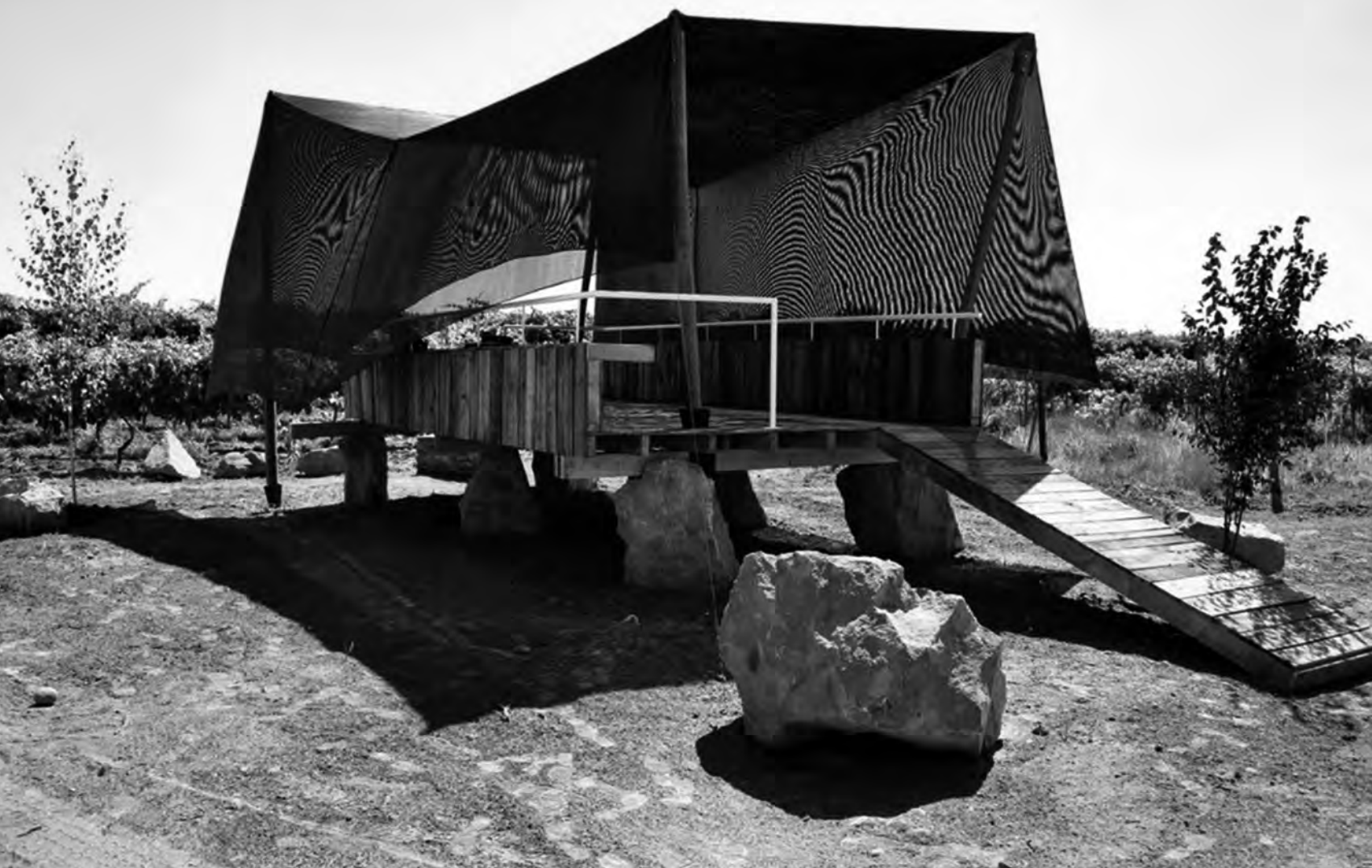
FIGURA 10: Obra de título: Mirador comedor emergente de Javier Rodríguez. Los Niches, 2011. Fotografía: Javier Rodríguez.

dad de Talca, el cual se encarga de instruir a un alumno cuyo perfil de formación apunta al de más escasos recursos, con el nivel de educación secundaria más bajo del país y con menor capital social, lo que se compensa a través de la cercanía y sensibilidad material que ellos poseen. Un buen ejemplo es el ejercicio que debe desarrollar cada alumno durante el Taller de la Materia en el Taller de Proyectos de primer año. El encargo consiste en que el alumno debe construir un cubo con materia del Valle Central en un formato de 25 cm de arista (Figura 9). De este modo es posible realizar una primera aproximación material por parte de los alumnos a través de una serie de cubos confeccionados a partir de verduras, de ramas secas, de barro, de metal oxidado, de telas, de cuerdas, entre otros, que han ido ocupando distintos espacios en las aulas de la escuela. Cada cubo habla de una relación particular del alumno-habitante con un sector del Valle Central de Chile y la materia que compone ese lugar. Cada cubo narra una particular manera de habitar el Valle Central de Chile. De esta manera es posible precisar el fuerte vínculo existente entre el habitante, su paisaje y su materia.