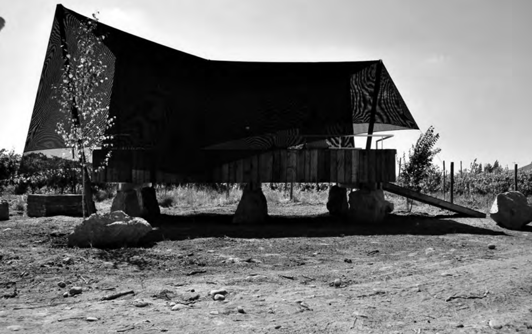
FIGURA 11: Obra de título: Mirador comedor emergente de Javier Rodríguez. Los Niches, 2011.

ortogonal. La obra se aferra a un lenguaje propio de su contexto inmediato, como por ejemplo las rocas provenientes de un río cercano al lugar, la madera de bines de deshecho, las varas de eucaliptos, la malla y el alambre de los cercos. Es así como la obra no busca más que resolver un encargo desde lo rural, a través de las materialidades y lógicas proyectuales propias del lugar y de su habitante (Figuras 10 y 11).