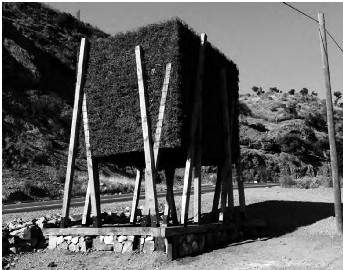
FIGURA 14: Proceso de secado de maíz en Pumanque, 2008.