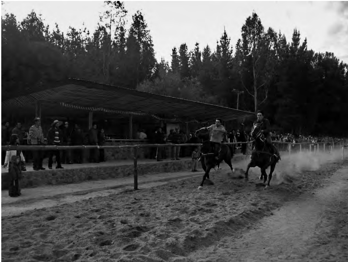
FIGURA 12: Obra de título: Pabellón de carreras a la Chilena . Gualleco, 2007.