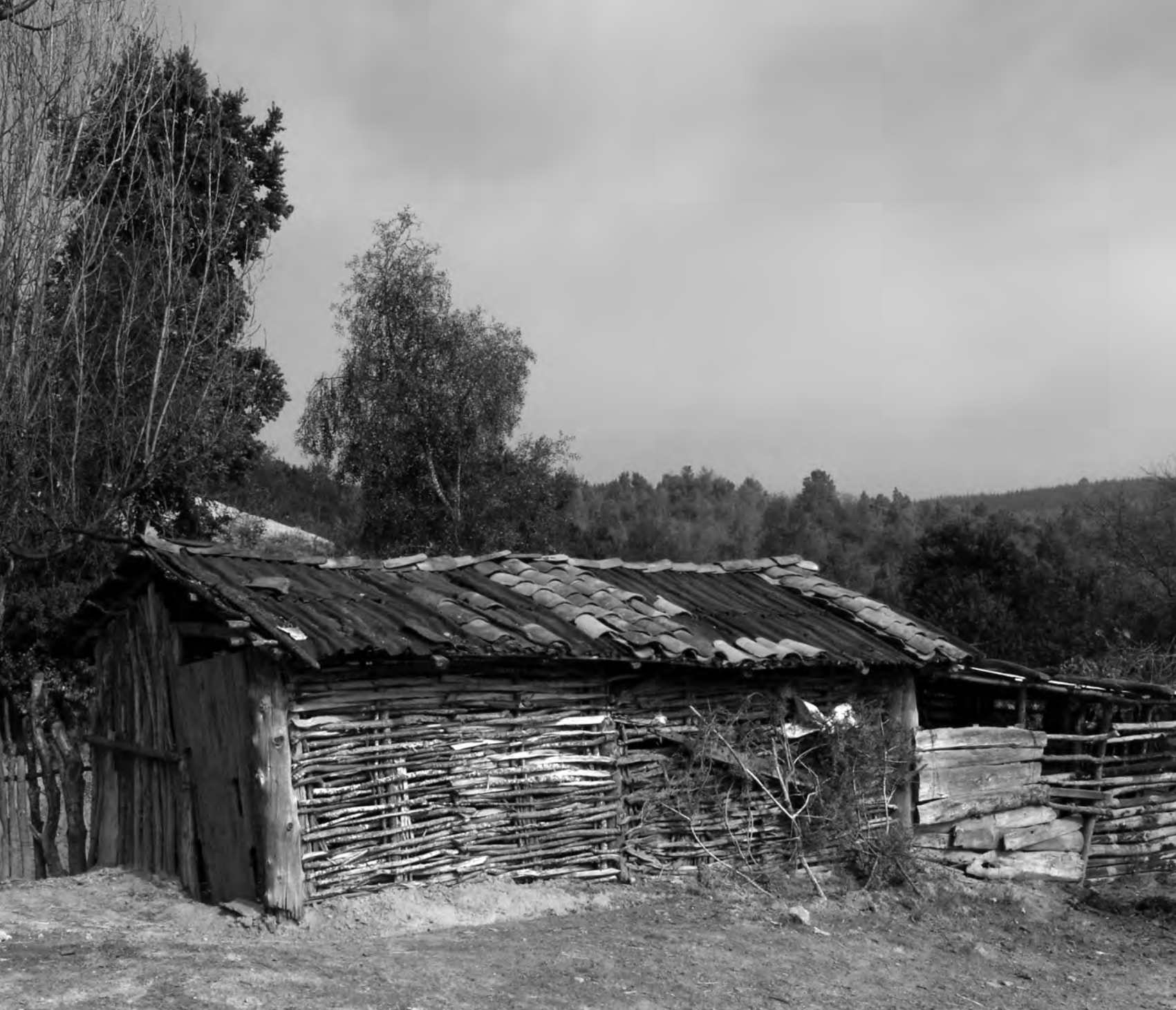
FIGURA 1: Bodega de acopio y secado de maíz en Batuco.