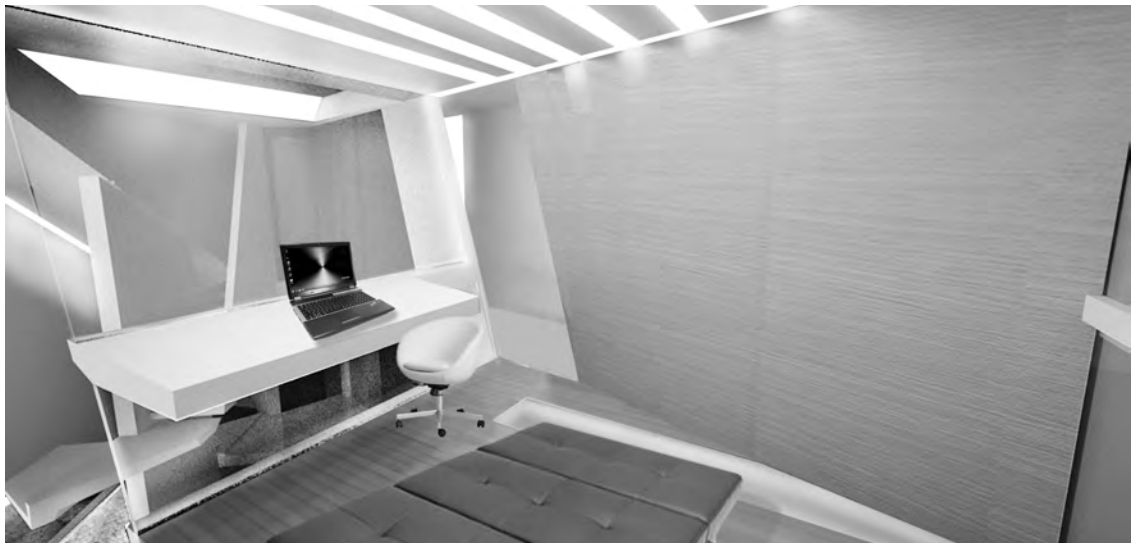
Mutabilidad nº 2: Arriba: dormitorio unificado. Abajo: segregación de dormitorio.