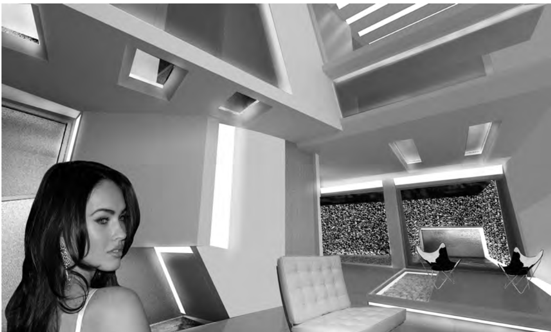
Mutabilidad nº 1: Arriba: segregación comedor-estar. Abajo: fusión comedor+estar.