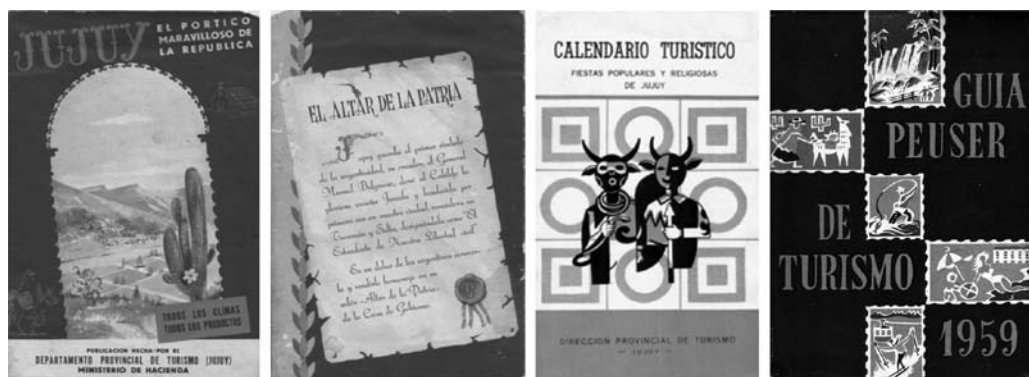
Figura 1. Promociones turísticas de Jujuy en la década de 1950

Otro aspecto que toma mayor fuerza luego de la Declaratoria son las fiestas populares cuyo registro se amplía notablemente. Ahora comienzan a mencionarse, por ejemplo, la Manca Fiesta (en La Quiaca), el encuentro de Copleros en Purmamarca, las celebraciones de la Pachamama y una gran cantidad de fiestas patronales vinculadas al calendario católico que tienen lugar en las distintas localidades de la Quebrada. Esto claramente contribuye a ampliar el espectro cultural que se quiere promocionar. (Figura 5)