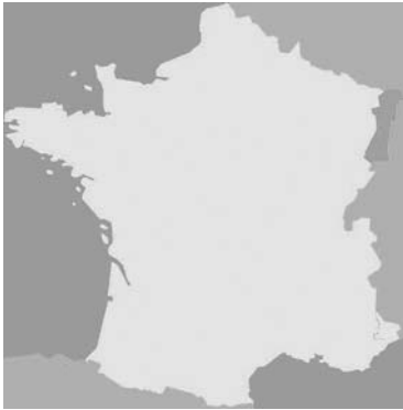
Figura 1. Parque Regional «Ballons des Vosges» en Francia