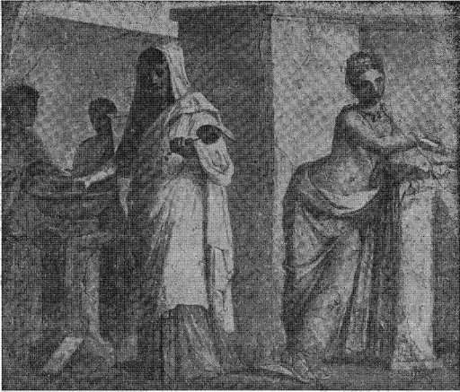
3. Las Bodas Aldobrandinas