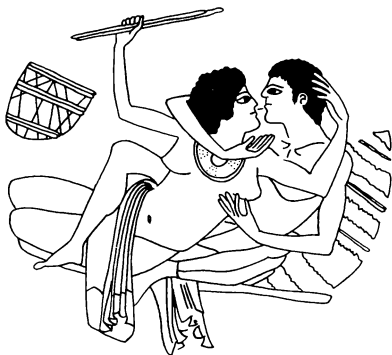
ILUSTRACIÓN 3: Copa del pintor de Gales. Simposio. Interior con pareja acariciándose sobre los almohadones del triclinio. Dibujo de Bernardo Vallejos

composición con dos parejas del Museo de Bruselas. 22