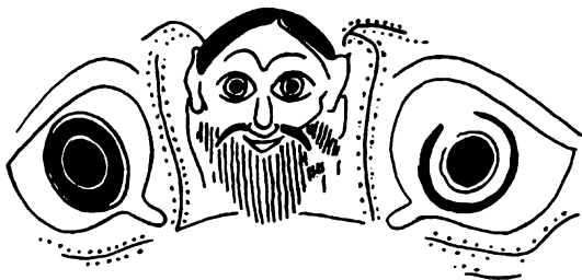
ILUSTRACIÓN 1: Copa de ojos. Pintor de Andocides. Decoración del exterior. Sátiro entre dos ojos. Dibujo de Bernardo Vallejos

donan al placer sin medida; en el simposio, por el contrario, regían reglas de convivencia, acuerdos entre los participantes para dosificar el placer. La manera adecuada de mezclar el vino con el agua distinguía el simposio humano del desenfreno de los sátiros. Se elegía a un "rey del simposio" ( symposiarkhos ) encargado de controlar la mezcla del vino; según las proporciones elegidas cambiaba el carácter de la reunión. Así lo señaló el poeta cómico Eubulo: