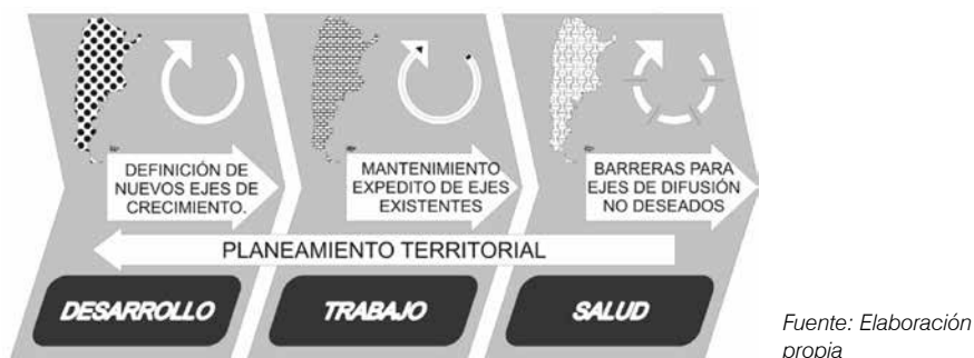
Figura 3. Vínculo entre patrones espaciales

zarse los mismos patrones espaciales en los tres casos, aunque son diferentes las pautas de ordenamiento que deben aplicarse. Para simplificar este aserto, podría decirse que la acción planificadora responde a objetivos a veces contradictorios: los corredores de desarrollo, por lo general, «se abren»; los de circulación laboral «se mantienen expeditos», y los de salud «se interrumpen». Lo interesante radica en que, a menudo, estos corredores coinciden, a veces sólo en algunos de sus tramos componentes y otras en su totalidad.