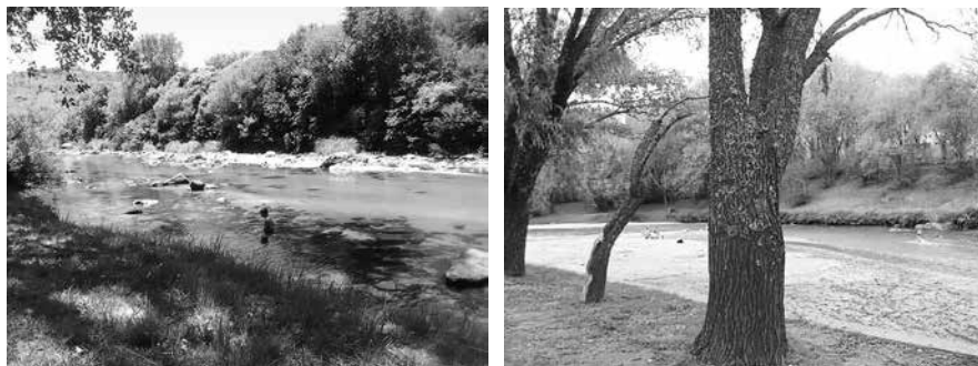
Año 2012. Figura 2 y 3. El río Barrancas.

En el caso de los que viven gran parte del año en Alpa Corral, como lugar de residencia, manifiestan... “te puedo contar poco ya que el río no me gusta” (Beatriz) y ese lugar (haciendo referencia a lo que observa en las fotos) está acá cerca... el otro lugar no me doy cuenta dónde es... lo que pasa es que ustedes ven las cosas que nosotros no vemos” (Carlos).