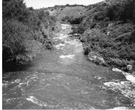
Figuras 5 y 6. La Unión de Los Ríos Talita y Las Moras Año 1992.