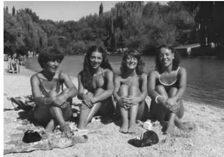
Figura 8 y 9. Río Barrancas en la zona del puente

Año 1972 y 1980.