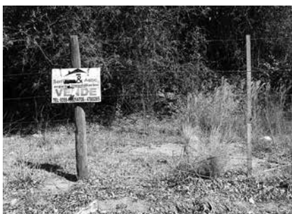
Figura 14 y 15. Loteos próximos al Río Barrancas Año 2018.