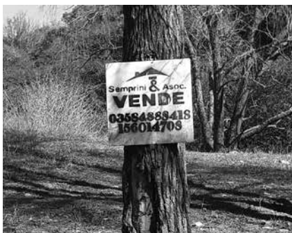
Figura 12 y 13. Loteos próximos al Río Barrancas Fuente: Elaboración propia. Año 2018.