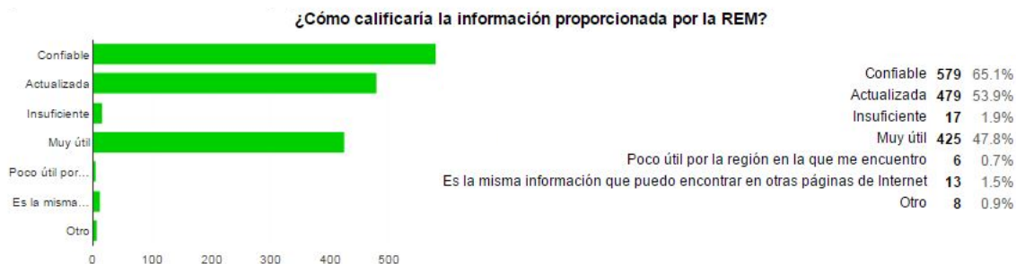
Figura 3: Valoración de la información de la red hecha por los usuarios.