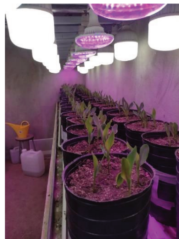
Figura 4. Híbridos de maíz con 7 días