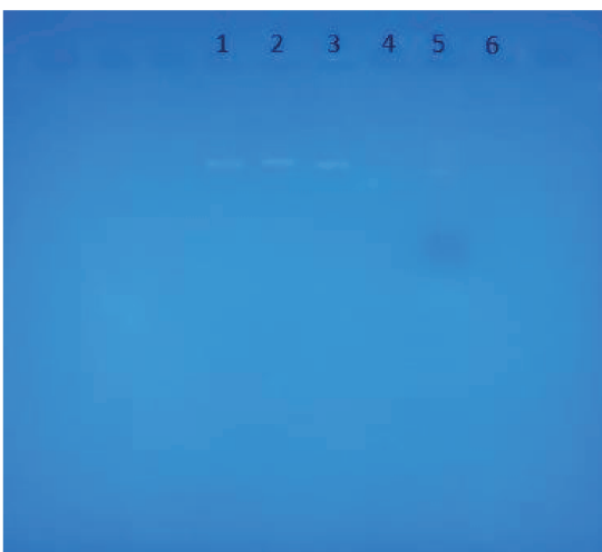
Figura 3: Resultado de electroforesis.