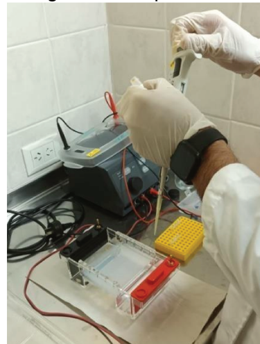
Figura 2. Electroforesis del material amplificado por PCR.