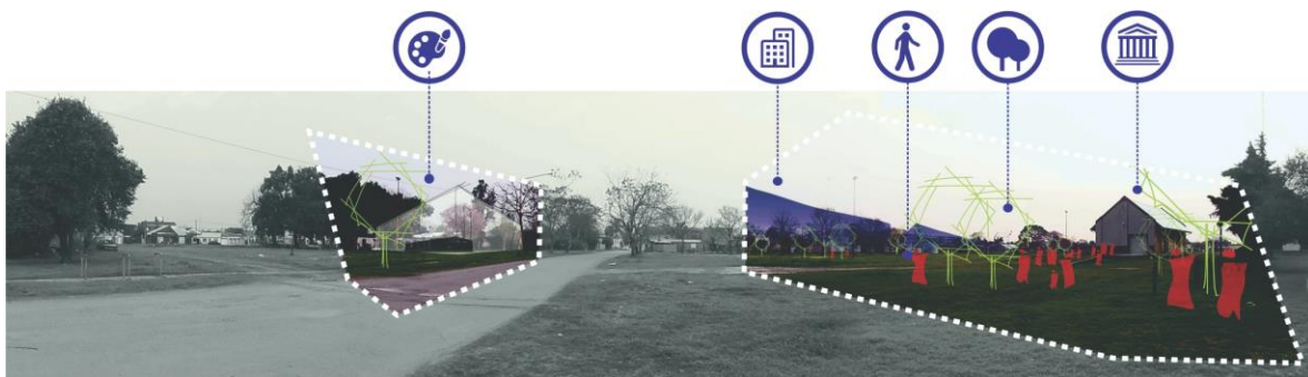
Figura 2: Ensayo de posibilidad de transformación del área vacante correspondiente al predio del ex ferrocarril. Elaboración propia

La intervención en estos espacios deberá, como premisa ya establecida en los objetivos, propugnar un desarrollo sostenible de la ciudad, mediante instrumentos como los masters-plan, planes particulares o particulares.