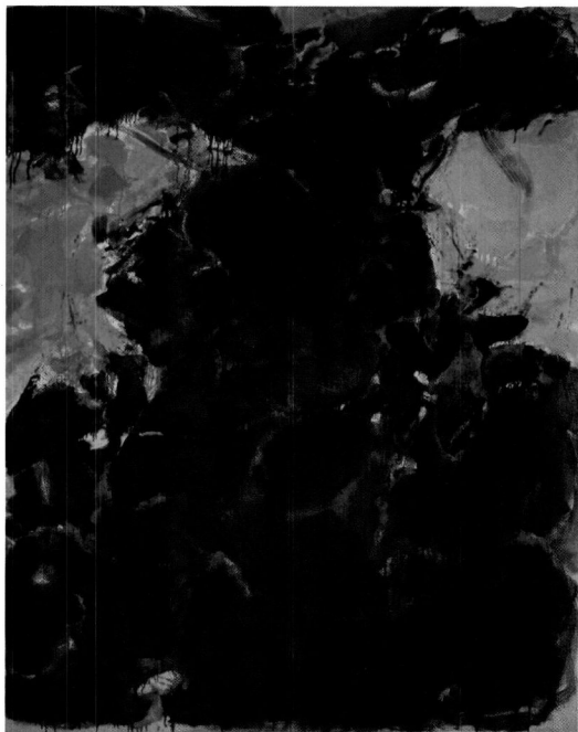
Azul oscuro, amarillo, rojo , 1956, óleo sobre tela, 162 x 130 cm.