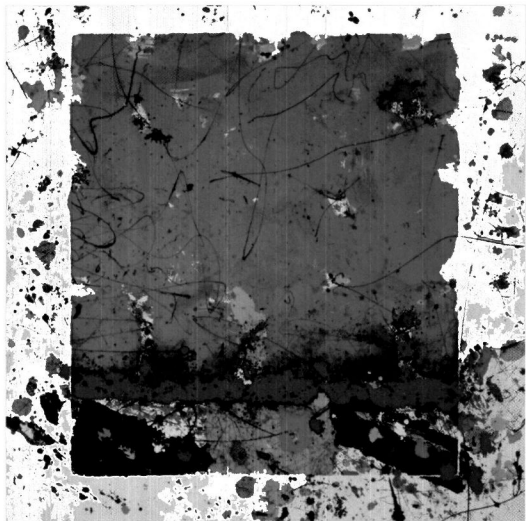
Sin título , 1980, monotipo, 88.3 x 86.7 cm.