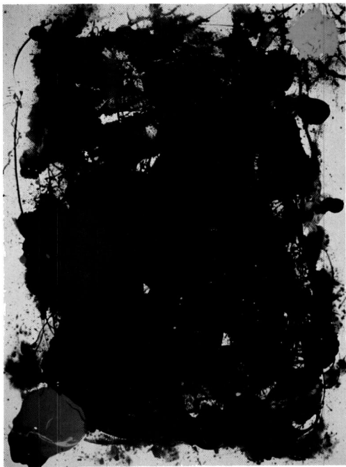
Sin título , 1988/89, acrílico sobre tela, 488 x 365 cm.