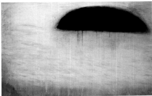
Negro silencio , óleo sobre tela, 100 x 140 cm.